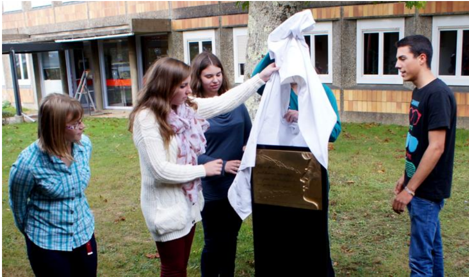
■ Les créateurs ont dévoilé leur réalisation installée au cœur du collège.